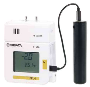
【使用例】 モバイルバッテリー(市販品)