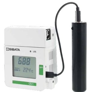
【使用例】モバイルバッテリー(市販品)