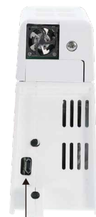
USBインターフェース